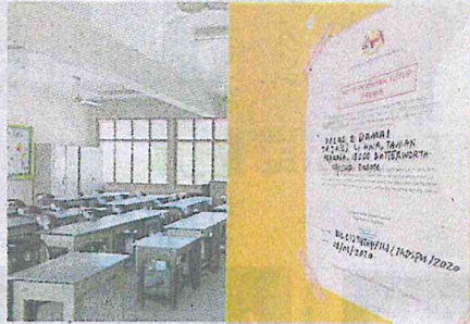
NOTIS penutupan yang ditampal di pintu kelas SJKC Li Hwa.

Katanya, pihak sekolah menghebahkan mengenai penutupan kelas di Facebook tetapi tidak menyangka ia tular hingga menimbulkan kekusaran dalam kalangan ibu bapa.