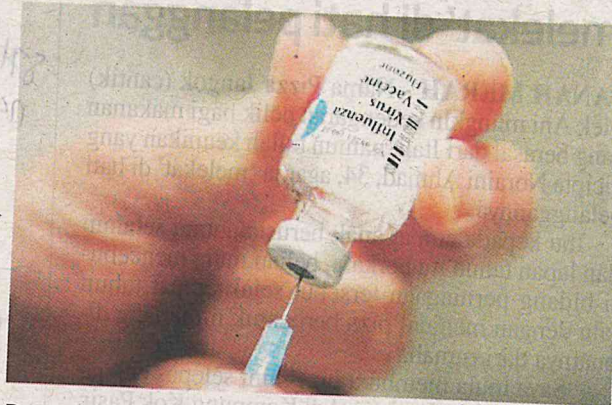
Permintaan terhadap vaksin virus influenza meningkat sehingga menyebabkan harganya melonjak sehingga RM120.

Dalam pada itu, seorang suri rumah di Jalan Klang Lama, Yusnilah Yunus, 38, berkata, beberapa buah klinik dikun-