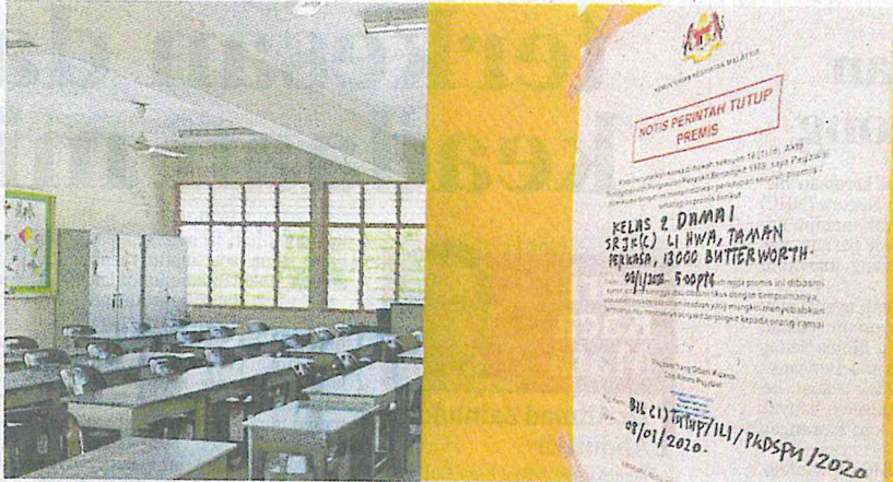
Notis penutupan sementara ditampal di dua kelas Tahun 2 SJKC Li Hwa, Butterworth, semalam.